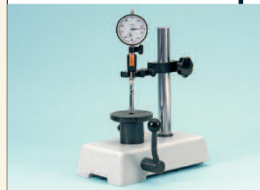
Messtisch OSM 6