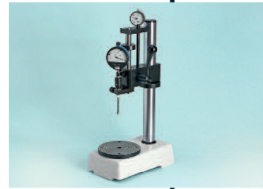
Messtisch OSM 5